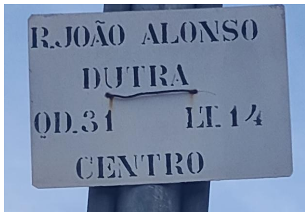
Identificação do lote vizinho