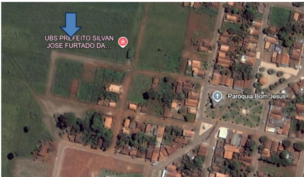
Situação em abril de 2005