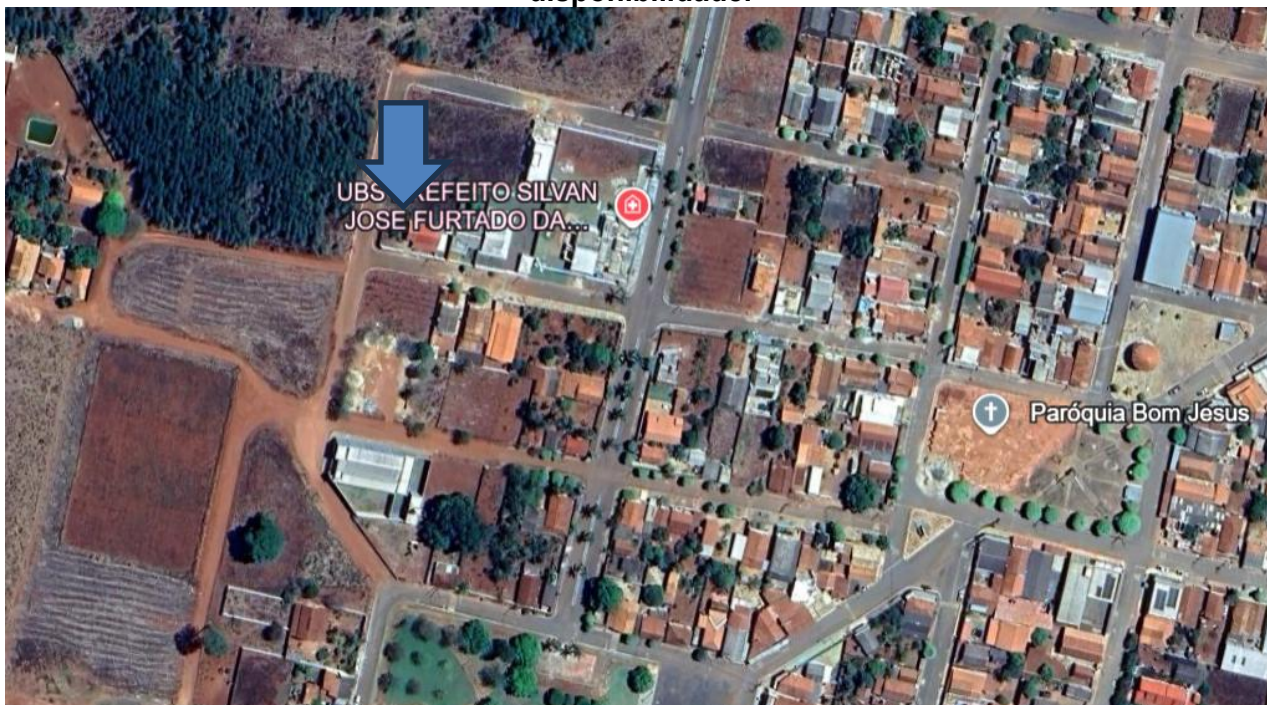
Situação em setembro de 2023

Foto Aérea e/ou imagem de satélite do imóvel (presente e/ou passado), conforme disponibilidade.