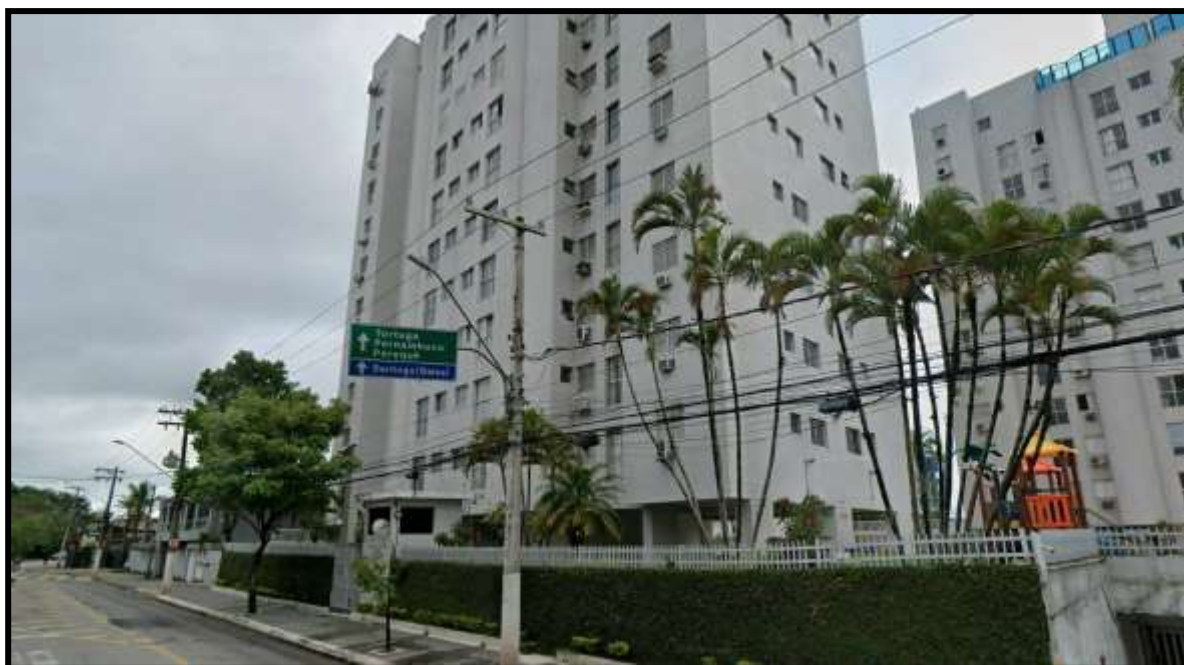
3. Vista do Condomínio Residencial Itaparica III pela Avenida Desembargador Plínio de Carvalho Pinto.