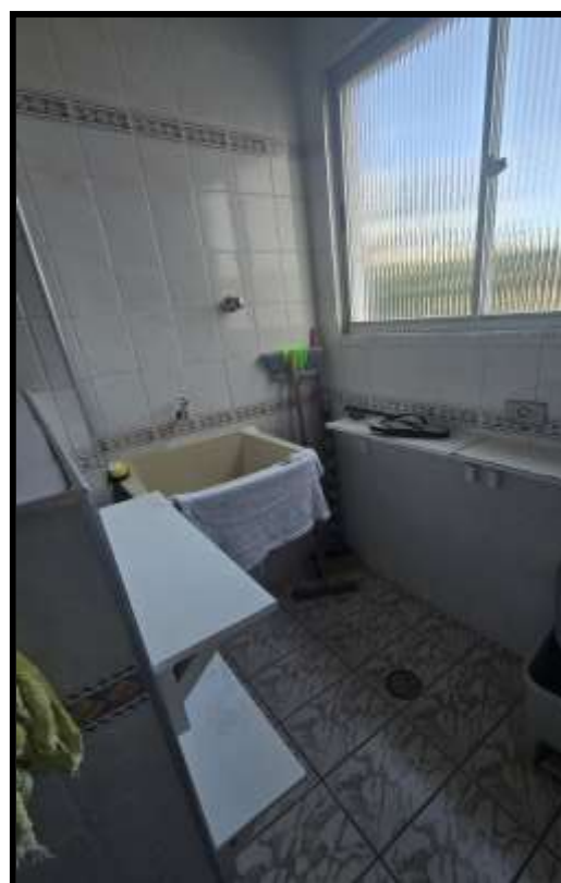
11. Vista da cozinha e da área de serviço.e