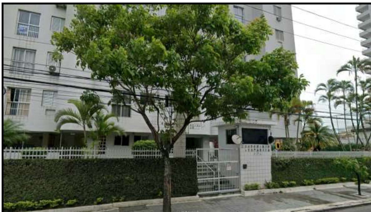
5. Vista da portaria de acesso ao Condomínio Residencial Itaparica III pela Avenida Desembargador Plínio de Carvalho Pinto.