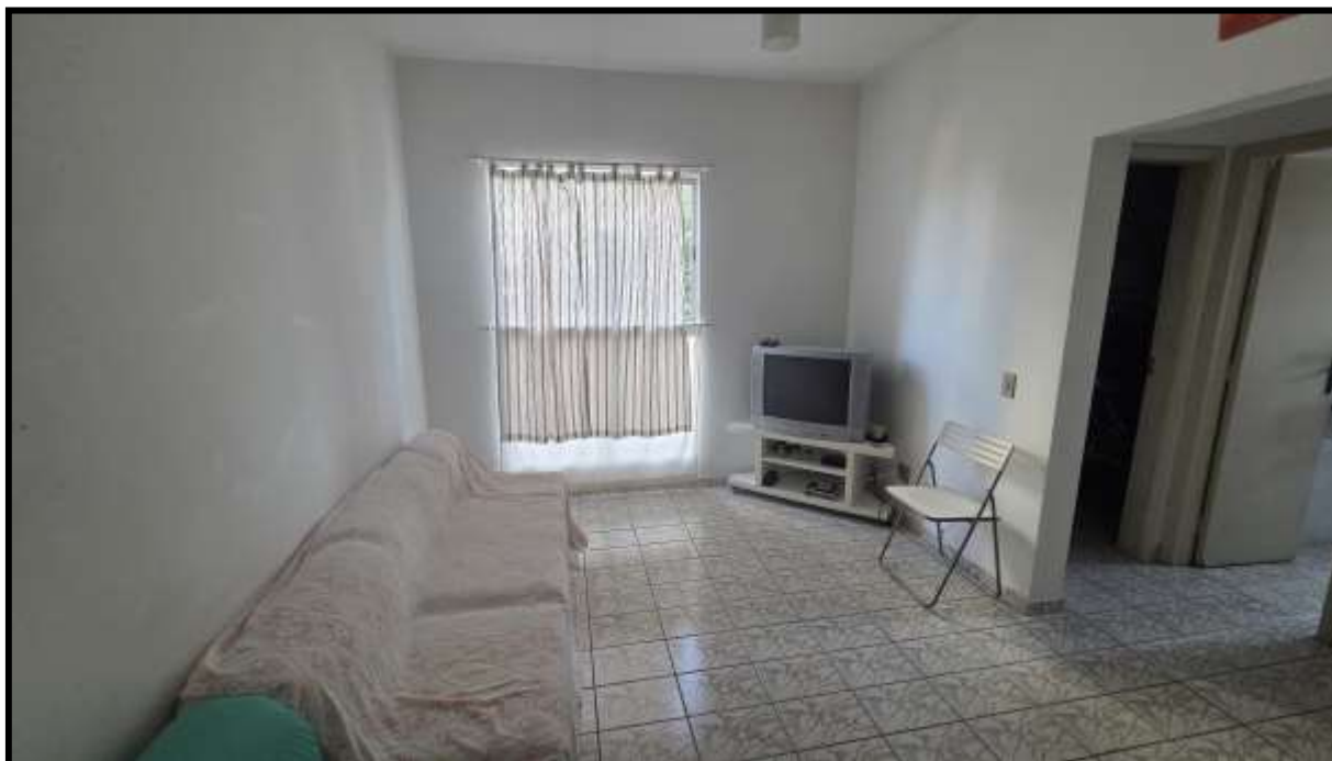
8. Sala de estar e jantar (apartamento de referência – nº 32 do Bloco A, como mencionado no item 1.5 do laudo).