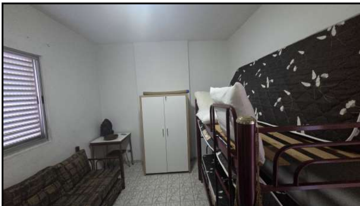
10. Vista do dormitório