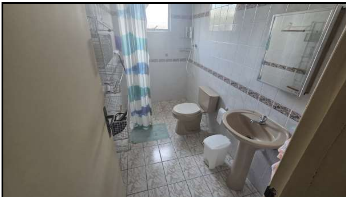
9. Vista do banheiro.