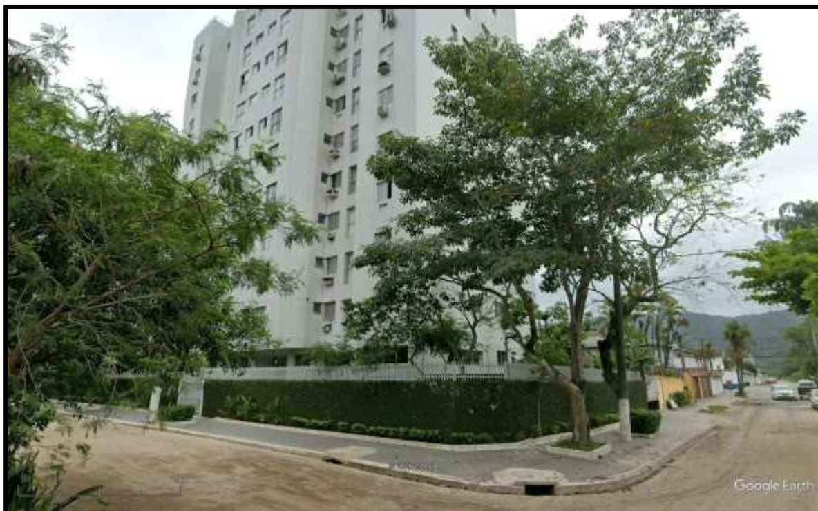
1. Vista do Condomínio Residencial Itaparica III na confluência da Avenida Professor João Batista Julião com a Rua Dona Leonor da Silva Quadros

Aparenta uma idade de 25 (vinte e cinco) anos.