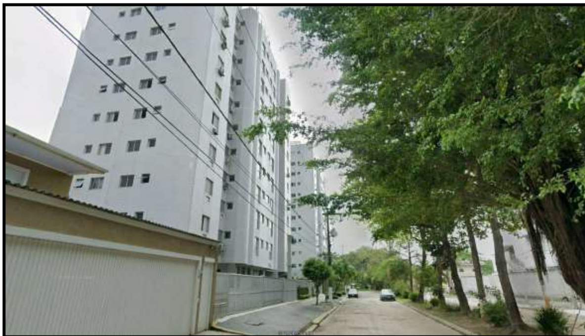
2. Vista do Condomínio Residencial Itaparica III na confluência da Avenida Professor João Batista Julião.