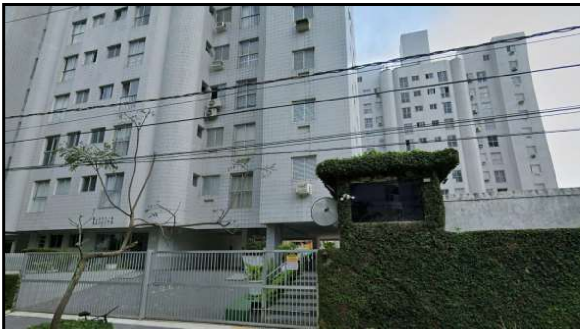
4. Vista da portaria de acesso ao Condomínio Residencial Itaparica III pela Avenida Professor João Batista Julião.