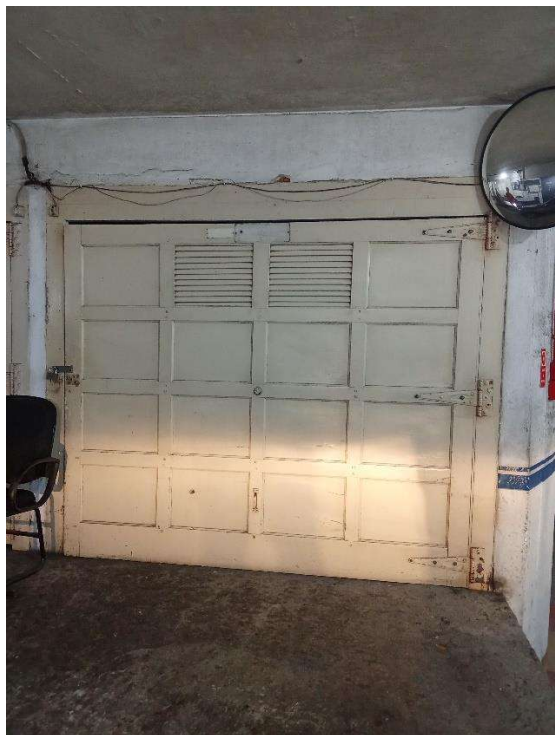
Porta de Acesso ao BOX 13 no Térreo