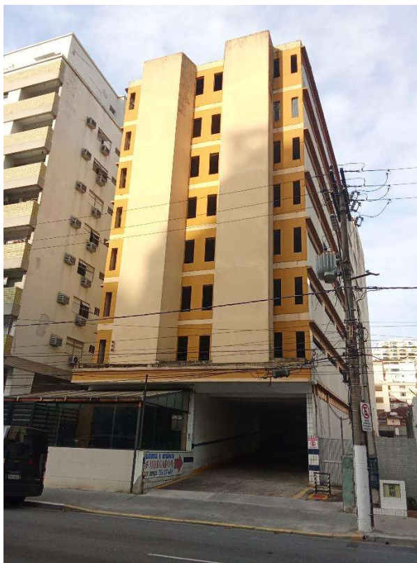
Fachada do Edifício Garagem