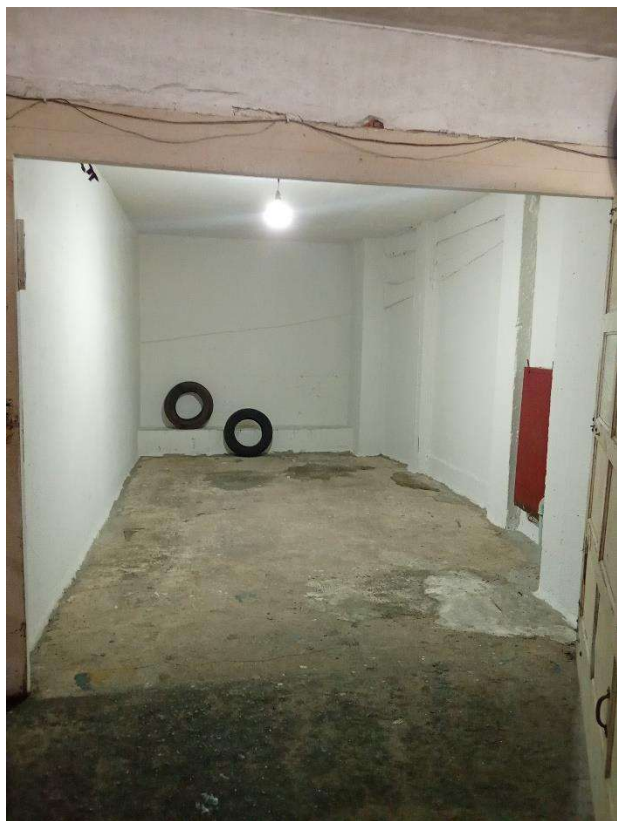
Interior do BOX 13